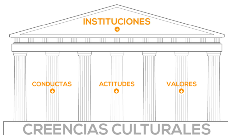
Diagrama 1: Elementos clave de la cultura

El Diagrama 1 muestra cómo las creencias culturales son la base de la cultura de país o grupo social. Se podría definir la cultura de un país como su "personalidad colectiva" . Es el reflejo de lo que sus habitantes valoran; de lo que creen que es bueno, justo o correcto; de las actitudes que tienen unos hacia otros; de las leyes y normas aceptadas por todos; y de las instituciones creadas para regular y aplicar estas leyes y normas.