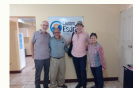
Visita Sur Global