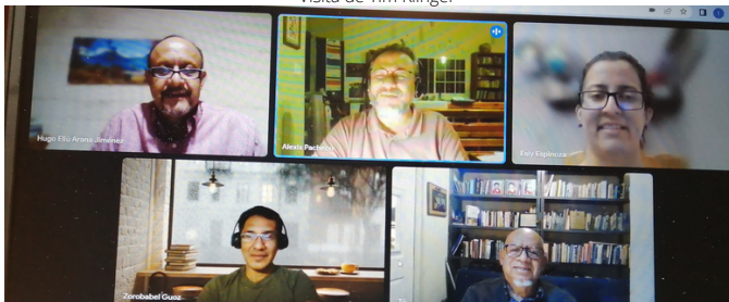
Firma convenio con Tearfund