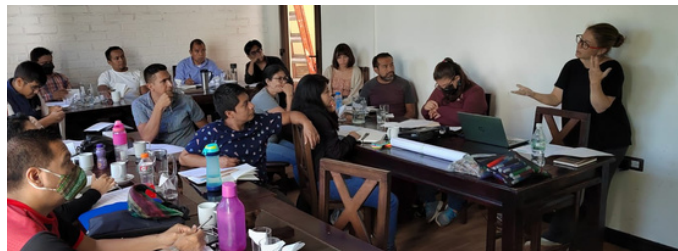
Taller Historias de Transformación