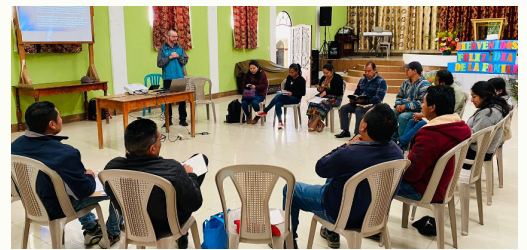
Fundamentos bíblicos, grupo de AMI San Lucas en Santa Clara la Laguna