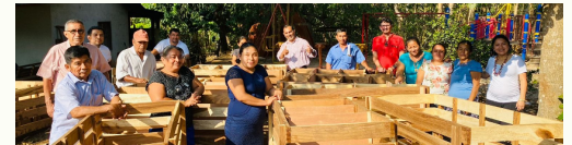
participantes de AMI San Lucas en Santa Clara la Laguna y de Saq B'e, en comunidad Caballo Blanco, Retalhuleu