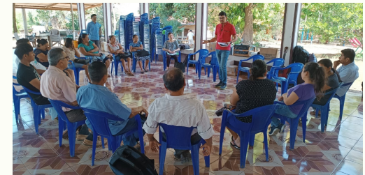
Fundamentos bíblicos, grupo de AMI San Lucas en Santa Clara la Laguna